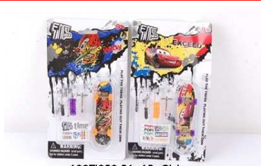
Mini deskorolka 1007I023