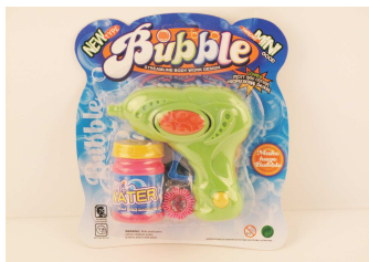
Pistolet na bańki 1011V092