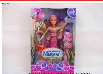
Lalka Syrenka 09040944