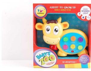
Pianinko krowka 1011M406