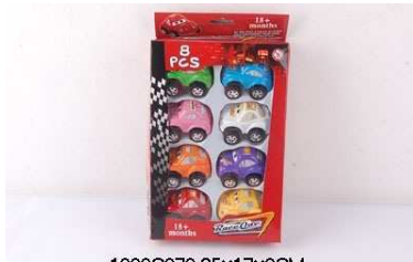
Autka 8 szt. 1009C076