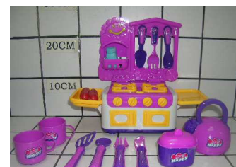
Kuchnia z naczyniami w siatce 0910U175

ul. Chwaszczyńska 131B, 81-571 Gdynia, Poland