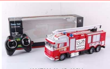
Straż pożarna na radio 1004F368