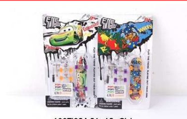
Mini deskorolka 1007I024

ul. Chwaszczyńska 131B, 81-571 Gdynia, Poland