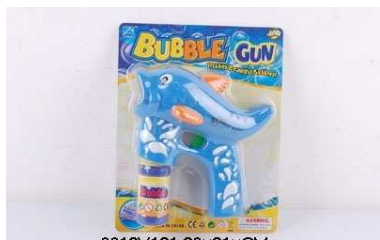
Pistolet na bańki 0912V121