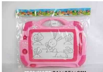
Znikopis w folii 1007K324