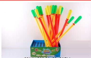
Pistolet na wodę 0911W208