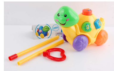
Pchanka edukacyjna 1011H369