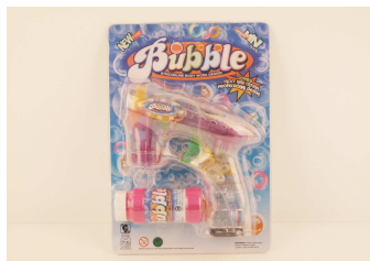
Pistolet na bańki 1011V091