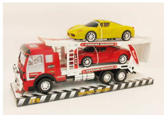
Auto laweta + 2 auta 1011A098