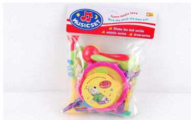
Instrumenty muzyczne 1012M007