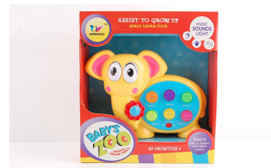
Pianinko słonik 1011M407