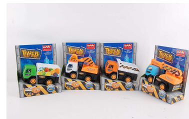
Autko budowlane 4 wzory 1012A289