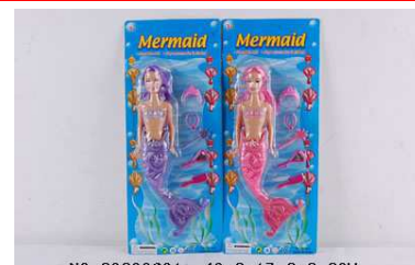
Lalka Syrenka 09020621