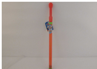
Pistolet na wodę 1011W436