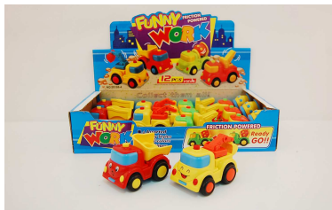
Auto napęd ruchome elementy 1011A1363