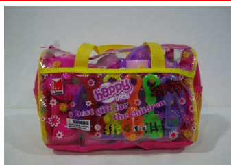
Naczynia w torbie 0911U175