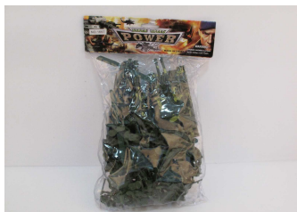
Wojsko w worku 1011Y304