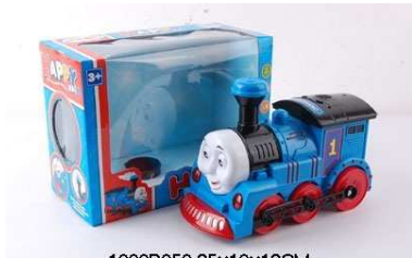
Lokomotywa n/b 1009B050