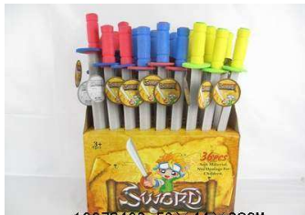
Miecz piankowy 1007S402