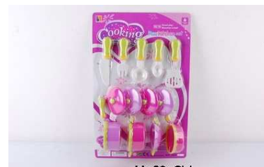
Naczynia na blistrze 1003U340