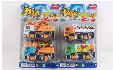
Autko budowlane 2 szt. 1012A301