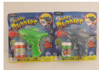
Pistolet na bańki 1011V162