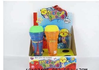
Mikrofon echo ze światłem 1010Z485