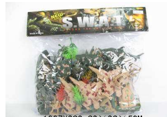
Wojsko w worku 1007Y282