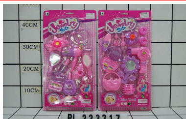
Zestaw dla dziewczynki PL223317