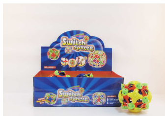
Piłka rozkładana duża 1011K315