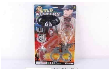
Zestaw kowboja na blistrze 1003G235