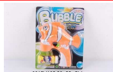
Pistolet na bańki 0912V102