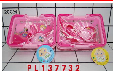
Naczynia w koszyku PL137732