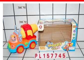
Auto budowlane na baterie PL157745-6