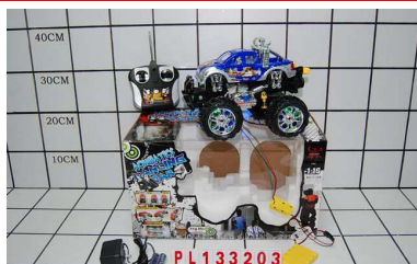
Jeep RC/lad funkcja try me PL133203