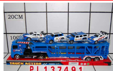
Laweta z autkami PL137491