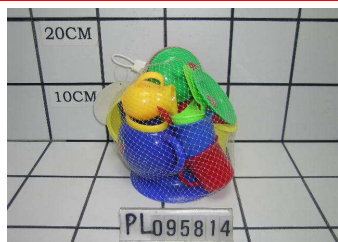
Naczynia kolorowe w siatce PL095814