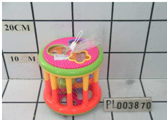
Zabawka edukacyjna walec PL003870