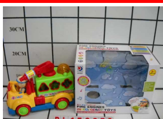
Auto edukacyjne na baterie PL152259-60