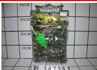
Wojsko w worku PL147353