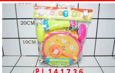
Instrumenty muzyczne PL141736