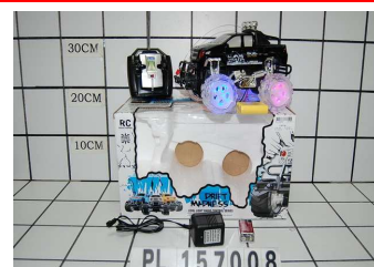
Jeep RC/tad św.koła PL157008-15