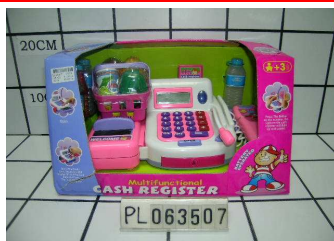
Kasa z kalkulatorem PL063507