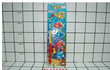
Wędką z rybkami PL145902