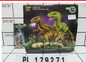
Dinozaur w jajku PL179271