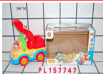
Auto budowlane na baterie PL157747-8