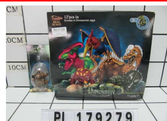
Dinozaur w jajku PI179279

ul. Chwaszczyńska 131B, 81-571 Gdynia, Poland