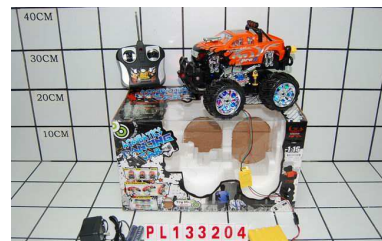
Jeep RC/lad funkcja try me PL133204