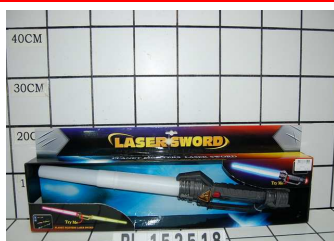
Miecz światło/dźwięk PL152518