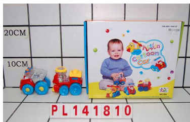
Pojazd z kulkami PL141810