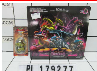
Smok w jajku PL179277