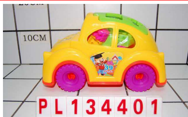
Auto edukacyjne z klockami PL134401