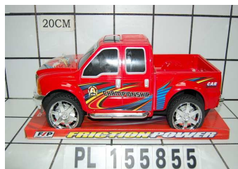
Pick-up duży PL155855