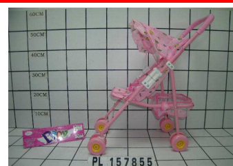
Wózek spacerówka PL157855