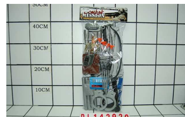
Zestaw żołnierz z lizakiem PL142929