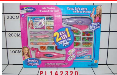
Koraliki do włosów zestaw PL142320