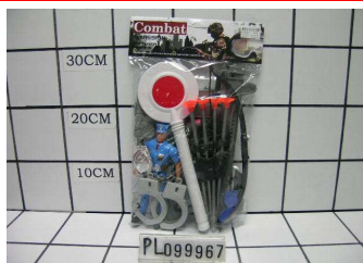
Zestaw policjanta z lizakiem PL099967