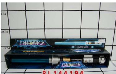
Miecz światło i dźwięk PL144194