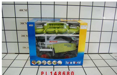
Kombajn wielki PL148680