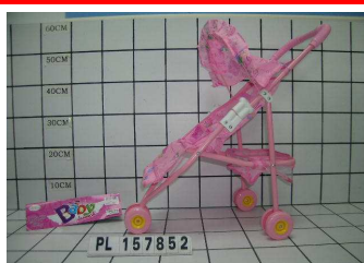
Wózek spacerówka PL157852