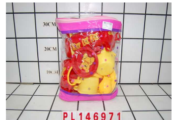
Naczynia w torbie duży zestaw PL146971

ul. Chwaszczyńska 131B, 81-571 Gdynia, Poland