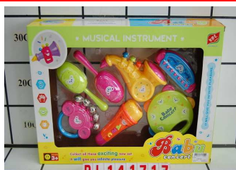
Instrumenty muzyczne/box PL141654-717