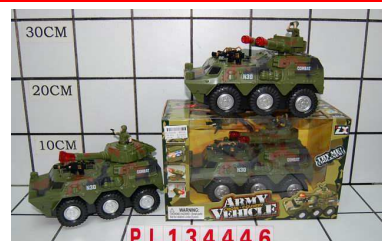
Auto wojskowe n/b PL134446