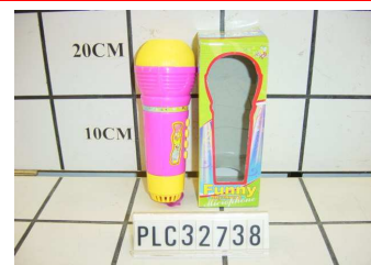
Mikrofon na baterie PLC32738