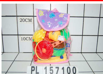
Naczynia w plecaku PL157100