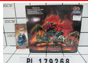
Smok w jajku PL179268