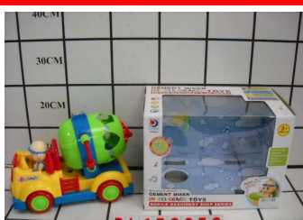
Auto edukacyjne na baterie PL152256-57