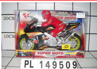
Motor z bateriami św/dźw PL149509