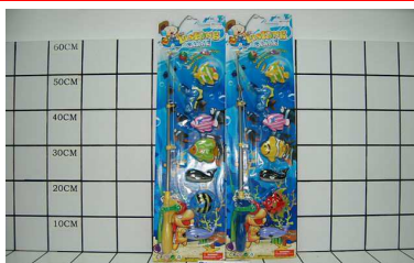
Wędką z rybkami PL121825