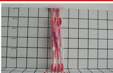
Wózek parasolka PL145401