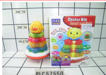
Piramidka muzyczna PLC57550