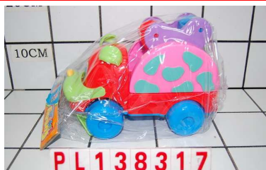
Ciąganka w worku PL138317