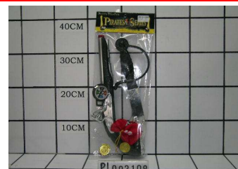
Zestaw pirata PL093108