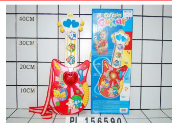
Gitarra ze zwierzątkami PL156590