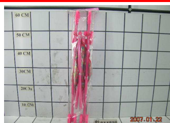
Wózek parasolka metal PL044830