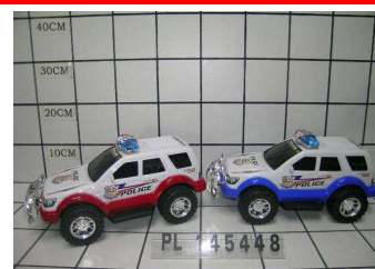
Auto policyjne w worku PL145448

ul. Chwaszczyńska 131B, 81-571 Gdynia, Poland