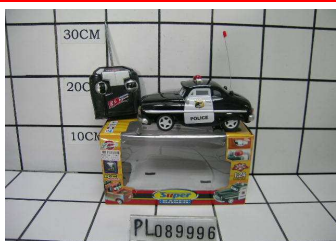
Policja na radio PL089996