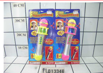
Mikrofon na baterie PL013346