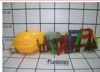
Narzędzia z kaskiem w siatce PL090082